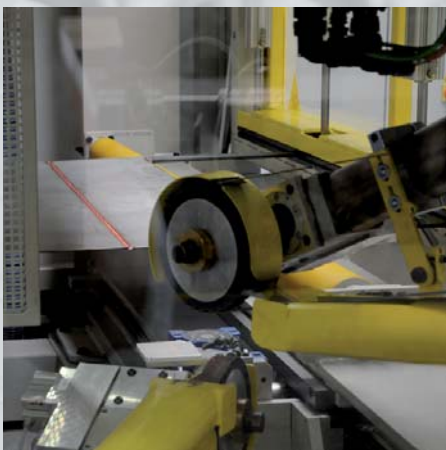
SYSTEMY DO SZLIFOWANIA SPOIN SCHLEIFENANLAGE FÜR SCHWEISSEN