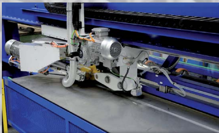
MASZYNY DO PUNKTOWEGO SPAWANIA PŁASZCZY SCHWEISSANLAGE FÜR ZWISCHENRÄUME

MASZYNY DO PROSTOWANIA I SZLIFOWANIA WALZ - UND SCHLEIFMASCHINEN FÜR SCHWEISSNÄHTE