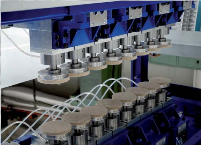
MASZYNY DO POLEROWANIA POLIERMASCHINEN – SPIEGEL POLITUR N° 8