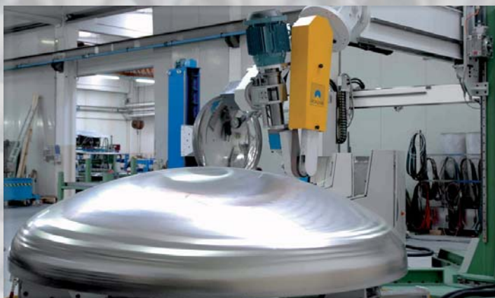
MASZYNY DO MARMURKOWANIA MARMORIERMASCHINEN

SYSTEMY CNC DO SZLIFOWANIA DENNIC I PŁASZCZY CNC SCHLEIF-UND POLIERANLAGEN FÜR BEHÄLTER UND