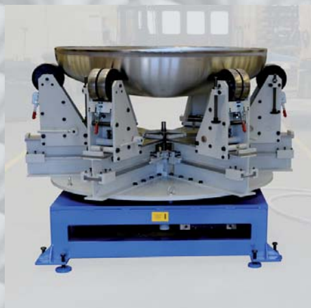
STÓŁ OBROTOWY DO DENNIC I ZBIORNIKÓW DREHTISCH FÜR BÖDEN UND BEHÄLTER