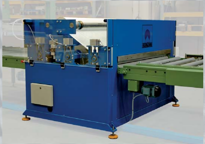
SYSTEMY WYGŁADZANIA Z AUTOMATYCZNYM ZAŁADUNKIEM I ROZŁADUNKIEM AUTOMATISCHE STAPENLAGEN MIT FOLIER UN POLIERMASCHINEN