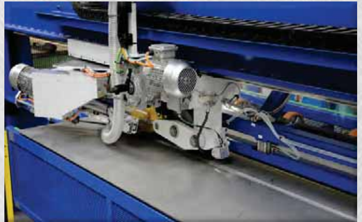
SCHWEISSANLAGE FÜR ZWISCHENRÄUME