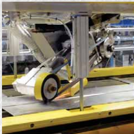
SCHLEIFANLAGE FÜR SCHWEISSYSTEME