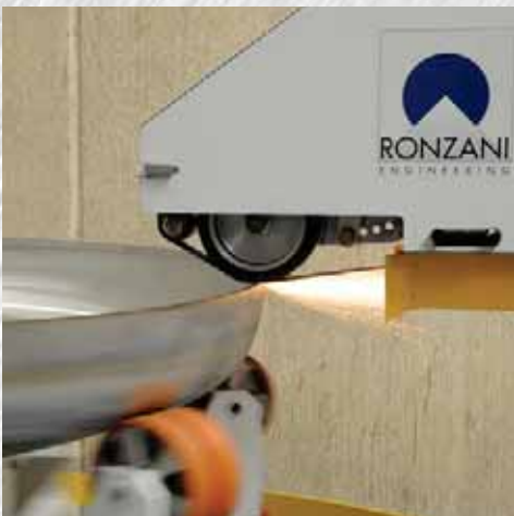
ANFASEN ANLAGE FÜR BOBEN